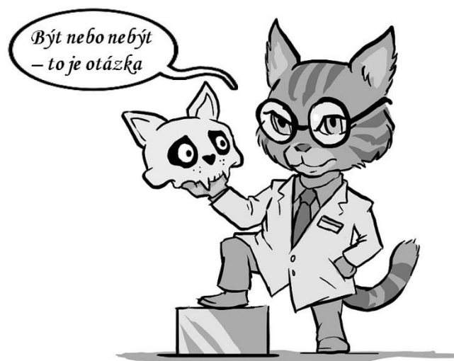
Obrázek: Petr Vyoral

Schrödingerova kočka a nový pohled na svět (Ilustrace: Petr Vyoral, tiskem 2022 – Amazon )