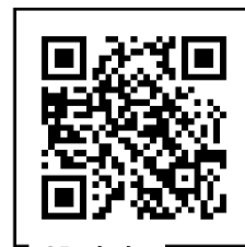
QR platba 157 Kč