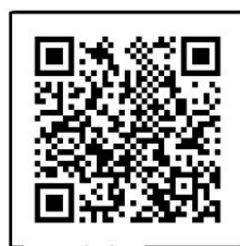
QR platba 57 Kč