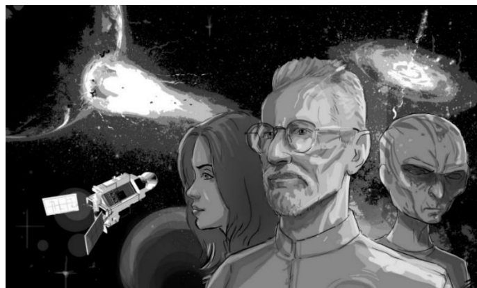
(Ilustrace: Petr Vyoral)